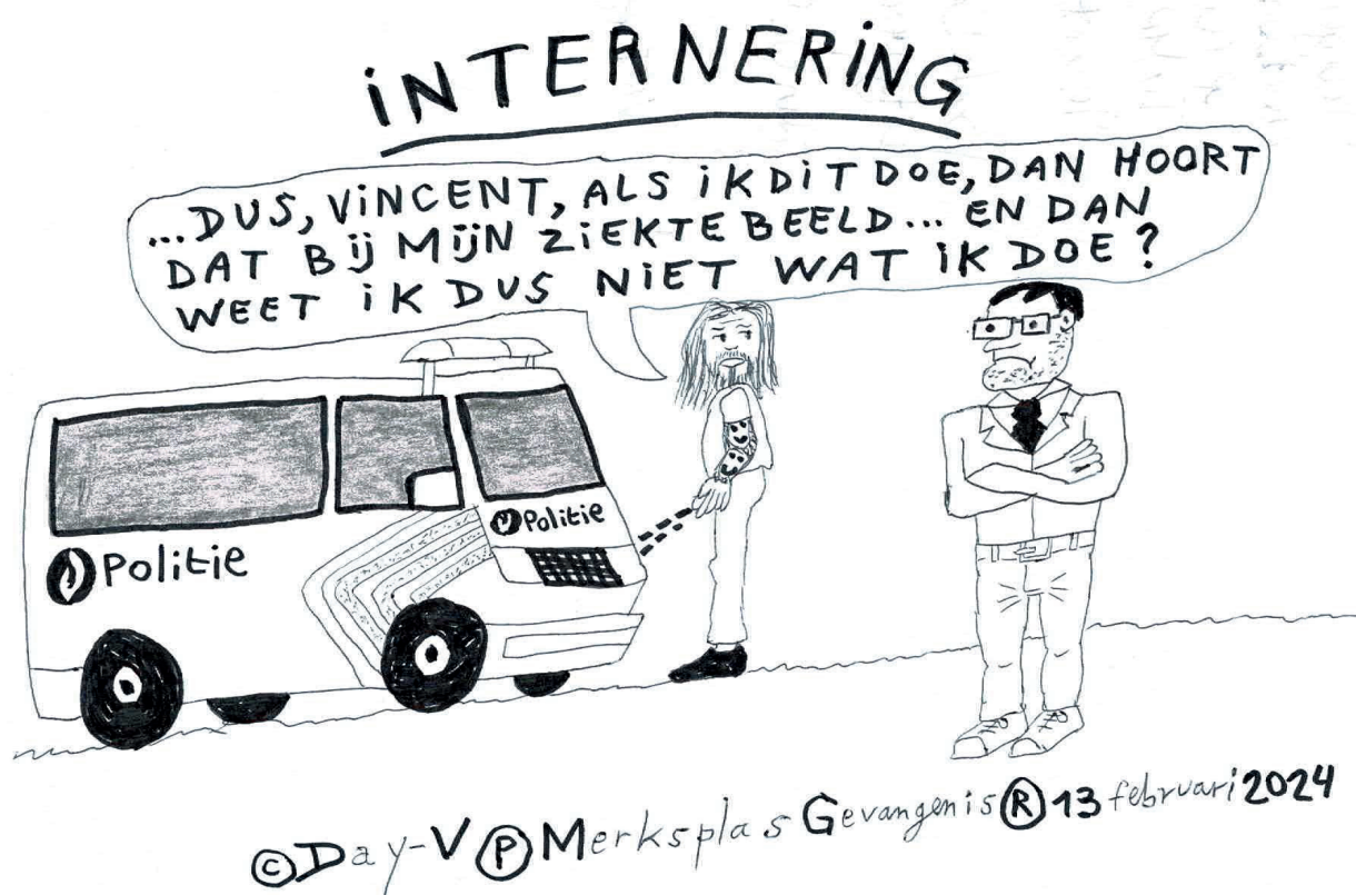
Davy "Day-V" Vanlommel