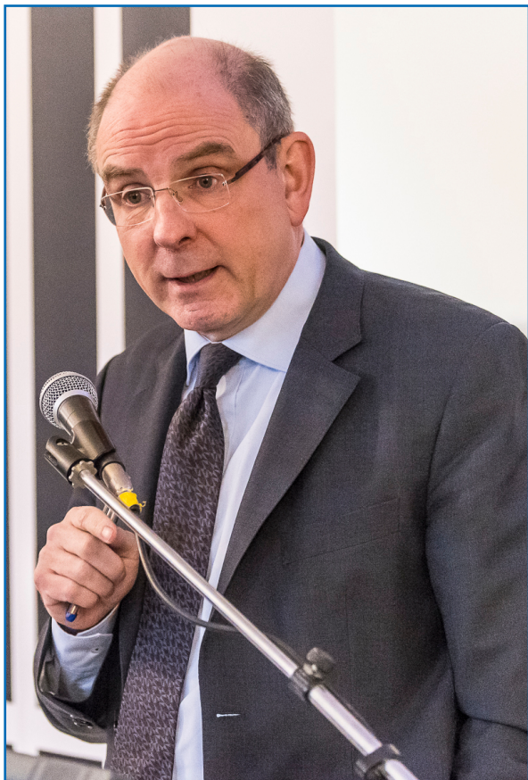
Minister van Justitie Koen Geens

Ook minister van Justitie Koen Geens tekende present. Naast felicitaties voor de winnaar, had hij woorden over het toekomstige mensenrechteninstituut in petto: "Het instituut komt er zeker," zei hij in een interview met AVS. "We hebben ten eerste een internationaalrechtelijke verplichting, en ten tweede: ik ben er al een heel tijdje mee doende. Ik moet dit samen met Mevrouw Demir doen. We zijn ver gevorderd en zullen dit voor het einde van de legislatuur kunnen afronden."